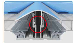
Abb. 10 mm Platten