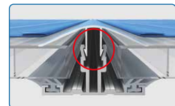
Abb. 16 mm Platten

Ausführliche Verlegeanleitungen und Videos sind abrufbar unter www.scobalit.de . Auf Wunsch senden wir Ihnen diese auch gerne zu.